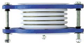
Fig. 3: 9061-5 產品外觀之一