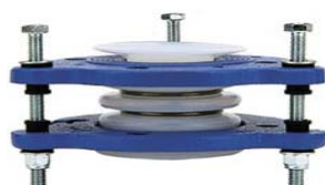
Fig. 2: 9061-3 產品外觀之二