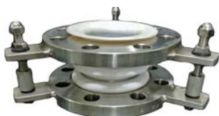
Fig. 1: 9061-3 產品外觀之一